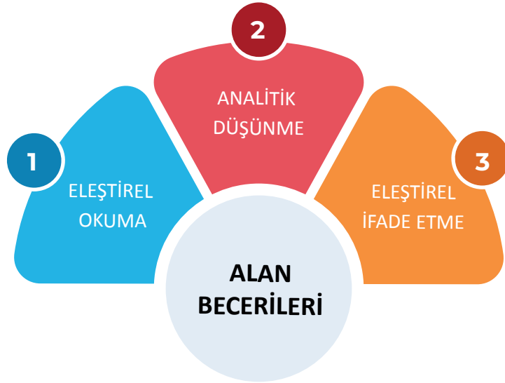
Şema 1: Metin Tahlilleri I-II Dersi Alan Becerileri

Metinlerin eleştirel bir gözle değerlendirilmesi, analiz edilmesi ve elde edilen sonuçların eleştirel biçimde ifade edilmesi amacıyla Metin Tahlilleri I-II Dersi Öğretim Programı'nda üç alan becerisine yer verilmiştir.